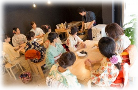
(↑制作現場イメージ)