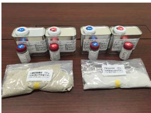
写真-4 ミラクルリペア・キット（材料）