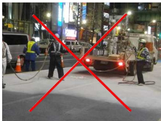
写真-3 特殊塗装機械は不要