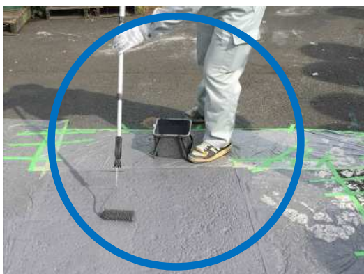
写真-2 塗装ローラーで簡単施行

遮熱性舗装は、日射エネルギー量の約半分を占める近赤外線を反射して、舗装路面の温度上昇を抑制する舗装です。年々、遮熱性舗装が新設される機会は増えておりますが、それに伴い、各種ライフライン改修起因による復旧工事需要も近年では増加傾向にあります。しかし、小規模の遮熱性舗装復旧は新設時と同じく特殊塗装機械（2液混合式エアレス吹付装置）を使用した施工がなされており、作業効率と経済性に優れておりませんでした。この問題を解決するために開発した工法が「ミラクルリペア工法」です。この工法では、遮熱塗料がローラーで施工できるため、機械の搬入・設定といった作業が不要になり、作業効率化が図れます。また、機械使用損料・塗料ロス（機械内残存分）が無くなるため、経済性も向上しますので、小規模復旧に最適な工法です。