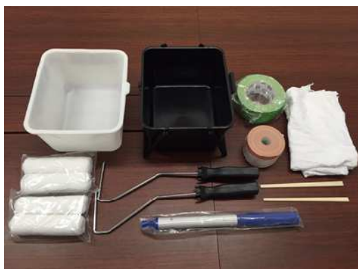
写真-5 ミラクルリペア・キット（道具）