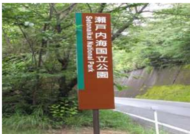
図－８ 国立公園内標識