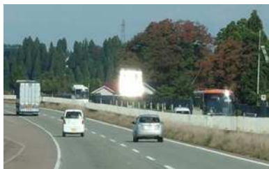
図－６ 従来技術写真 (太陽光の乱反射)