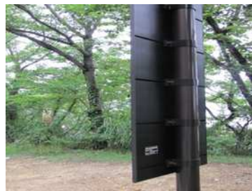
図－９ 国立公園内標識