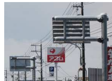
図－１０ 着雪時標識背面 (左：新技術、右：従来品)