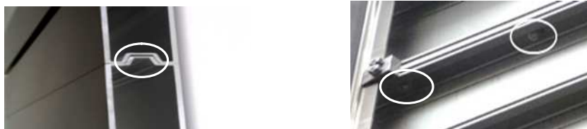
図-4 新技術 (○部凹凸の詰め込み)

(2) 新技術:(1)同様に現地で組み立てる時、接合作業は図-4のように標識水平側端面が凹凸になっている大小標識を詰め込むだけ(ボルト締めは不要)なので簡単、迅速である。接合作業に要する時間は表-1 記載の通り、従来技術に比べ、大小2枚で14分(16%)、同3枚で25分(25%)の時間短縮が可能。それによって道路規制の時間短縮にも繋がり、交通事故の低減及び車渋滞が避けられる。