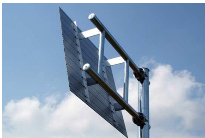
図-1 新技術 標識背面側 (水平側に補強リブを無くした一体構造)