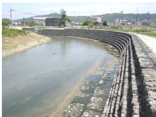
写真-1 多段積タイプ