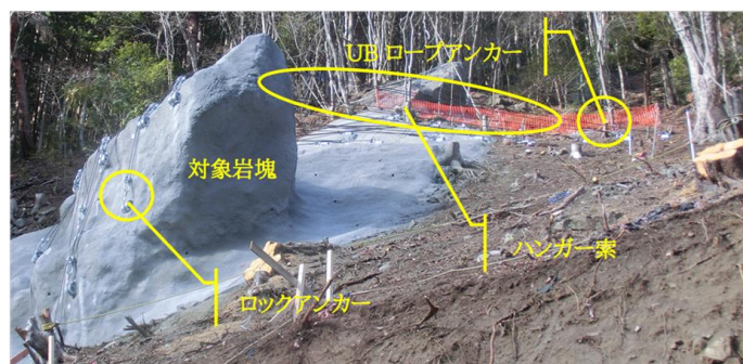
写真-1 巨大岩塊固定工法 施工例