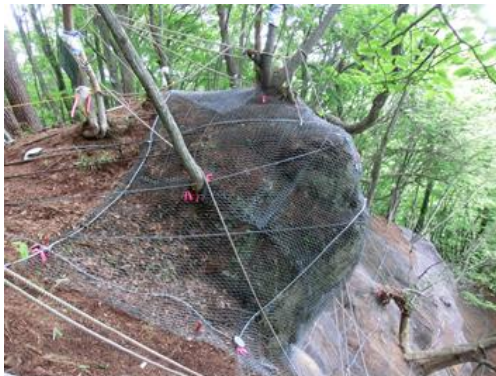
写真-2 金網を併用した場合の完成状態

岩塊や斜面の状況から、必要抑止力を算出し、ハンガー索全体抑止力がそれを上まわるような本数を決定するため、10,000kN以上の巨大岩塊にも対応が可能である。