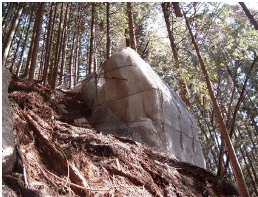
写真-3 金網敷設箇所（愛知県）

金網敷設やワイヤロープを格子状に組むことによって、対象岩塊を【面】的に抑え込む構造ではなく、対象岩塊に設置したロックアンカーと、斜面上部に設置したUBロープアンカーを結ぶことで【線】的に抑止力を持たせる構造であるため、立木の伐採を最低限に抑え、斜面整形がほとんど必要ない。