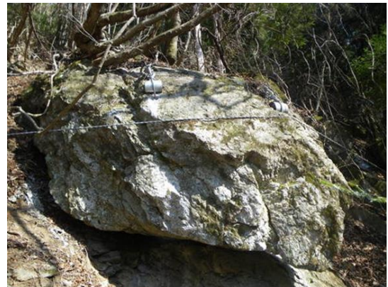
写真-4 ワイヤロープ設置箇所（東京都）