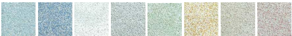
ライトブルー (RB) ブルー (B) ホワイト (W) グレー (G) グリーン (GR) イエロー (Y) ペーージュ (BE) サクラ (S)

アースクルー25 ブルー、グレー、ホワイトのパターン張りの停車場線です。通勤・通学・買い物など、多くの方が利用されるため、統一感のある爽やかなラインのデザインが採用されました。