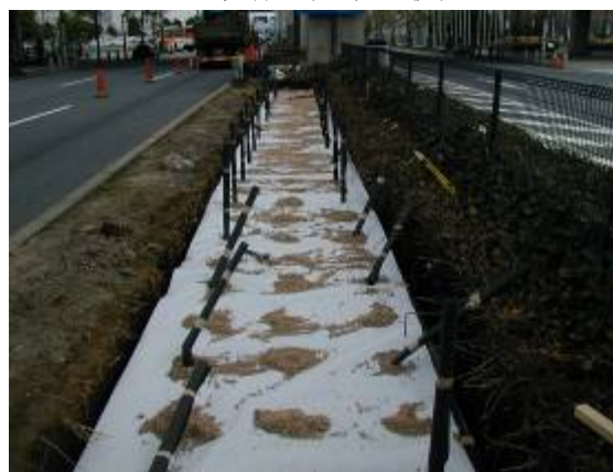
耐根シート、吸水材