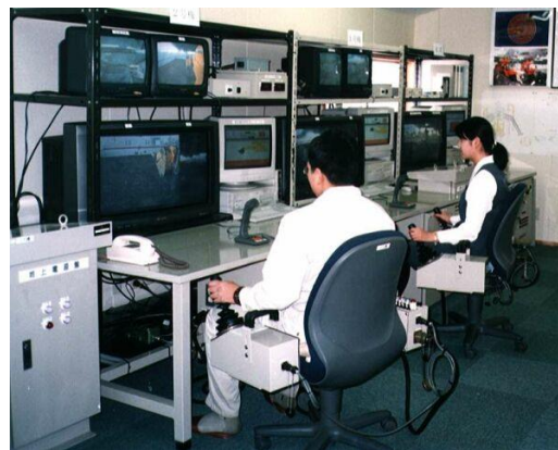
地上からの DREAM II 遠隔操作状況