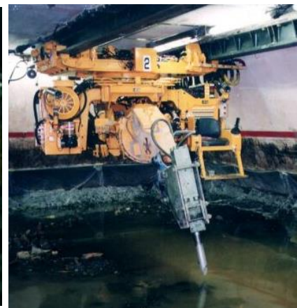
DREAM II 硬岩掘削状況