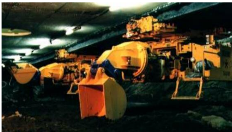
DREAM II 普通土掘削状況