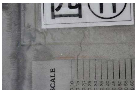
写真-1 0.1mmのクラック視認可能